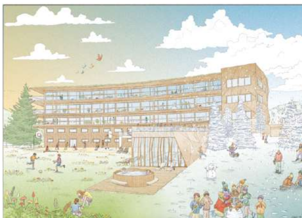
© Diane Berg - Projection après travaux

La maison familiale a démarré sa rénovation. En effet, en 2023, il n'était plus possible d'héberger le personnel, car les logements étaient devenus insalubres par l'humidité à la suite d'infiltrations d'eau. Après diagnostic, pour rechercher les causes des désordres, d'importants travaux ont été réalisés : terrassement, canalisation des eaux, complexe d'étanchéité et remise en place des terres sur la parcelle. En parallèle, d'autres diagnostics ont été lancés sur le bâtiment principal car il y avait des fuites et les installations montraient des signes de carence. La situation ne permettait plus d'attendre. Des travaux importants étaient indispensables pour garantir un accueil de qualité et durable pour les futures générations de Villemomblois.