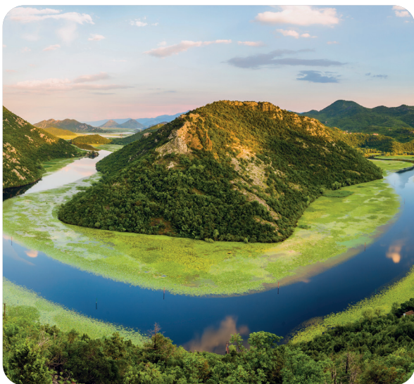
Lac de Skadar