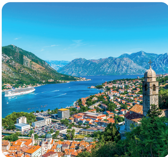
Baie de Kotor

Partez en voyage : un circuit de 8 jours / 7 nuits est organisé à travers le Monténégro.