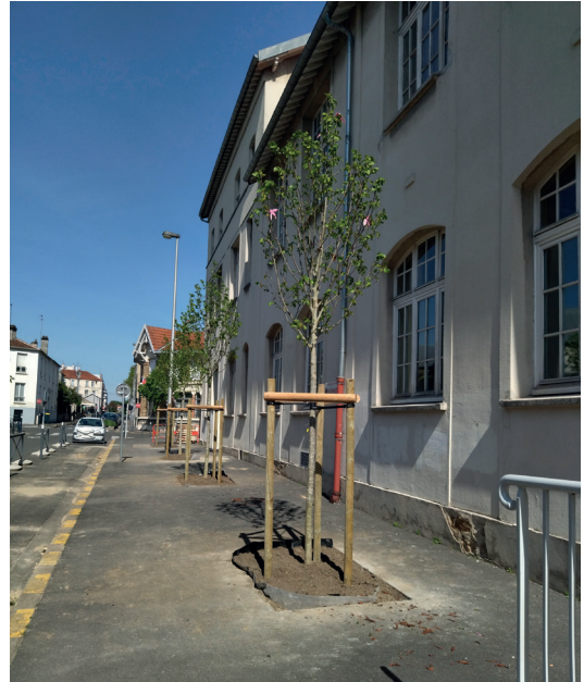
PLANTATION D'ARBRES - RUE SAINT-LOUIS