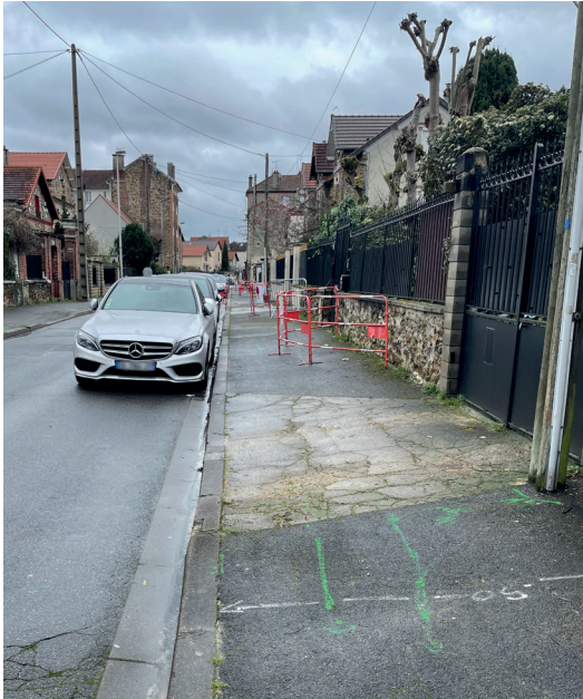
PLANTATION D'ARBRES - AVENUE DU GÉNÉRAL LECLERC